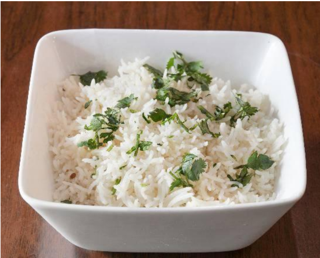
· Riz basmati au safran